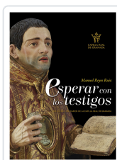
ESPERAR CON LOS TESTIGOS. RELIQUIAS CATEDRAL GRANADA REYES RUIZ, MANUEL