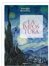
LA IMPOSTURA BERNANOS, GEORGES