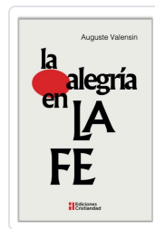
LA ALEGRÍA EN LA FE AUGUSTE VALENSIN