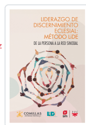
Liderazgo de discernimiento eclesial: Método LIDE LIDE, Equipo