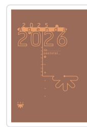
AGENDA DE PASTORAL 2025-2026 PPC PPC