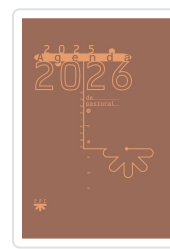
AGENDA DE PASTORAL 2025-2026 PPC PPC