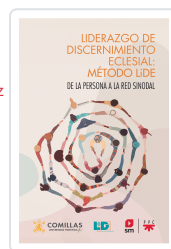
Liderazgo de discernimiento eclesial: Método LIDE LIDE, Equipo