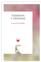
FEMINISTA Y CRISTIANA SCARAFFIA, LUCETTA