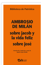
Sobre Jacob y la vida de feliz-Sobre José. nº135 Ambrosio, Santo, Obispo de Milán