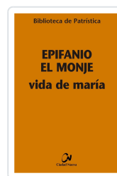
Vida de María Nº 8 Epifanio el Monje