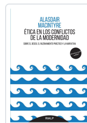
ÉTICA EN LOS CONFLICTOS DE LA MODERNIDAD. SOBRE EL DESEO EL MACINTYRE, ALASDAIR