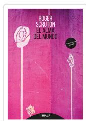
ALMA DEL MUNDO SCRUTON, ROGER