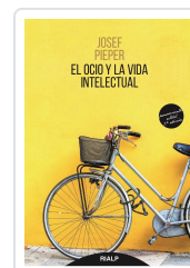
OCIO Y LA VIDA INTELLECTUAL, EL PIEPER, JOSEF