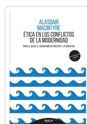
ÉTICA EN LOS CONFLICTOS DE LA MODERNIDAD. SOBRE EL DESEO EL MACINTYRE, ALASDAIR