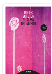
ALMA DEL MUNDO SCRUTON, ROGER