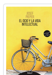
OCIO Y LA VIDA INTELLECTUAL, EL PIEPER, JOSEF