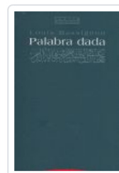
PALABRA DADA MASSIGNON, L