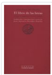
LIBRO DE LAS LETRAS, EL AL FARABI