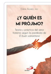
Y QUIEN ES MI PROJIMO? -LVAREZ, CHEMA