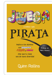
JUEGA COMO UN PIRATA ROLLINS, Q.