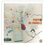
PINTO MI MUNDO 2 POTOLO BAT, MUXOTE