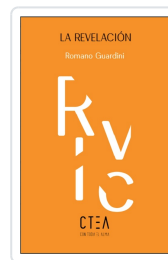
LA REVELACION Guardini, Romano