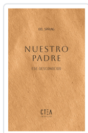
NUESTRO PADRE Sprung, Joel