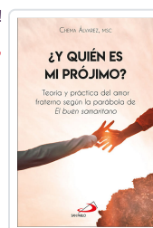
Y QUIEN ES MI PROJIMO? -LVAREZ, CHEMA