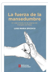
LA FUERZA DE LA MANSEDUMBRE LUIGI MARIA EPICOCO