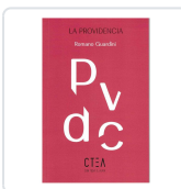
PROVIDENCIA, LA GUARDINI, ROMANO