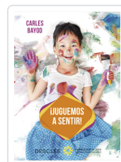
JUGUEMOS A SENTIR! BAYOD SERAFINI