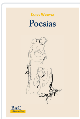
POESIAS. K.WOJTYLA WOJTYLA, KAROL