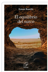
El equilibrio del surco Ermes Ronchi