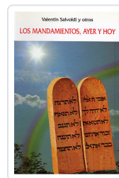
MANDAMIENTOS, AYER Y HOY SALVOLDI, VALENTIN