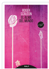
ALMA DEL MUNDO SCRUTON, ROGER