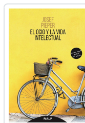
OCIO Y LA VIDA INTELLECTUAL, EL PIEPER, JOSEF