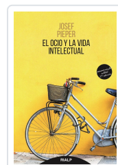
OCIO Y LA VIDA INTELLECTUAL, EL PIEPER, JOSEF