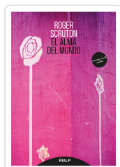
ALMA DEL MUNDO SCRUTON, ROGER