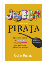
JUEGA COMO UN PIRATA ROLLINS, Q.