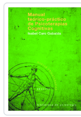
Manual teórico-práctico de Psicoterapias Cognitivas Nº142 Caro Gabalda, Isabel