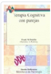
TERAPIA COGNITIVA CON PAREJAS. Nº 73 DATTILIO, FRANK