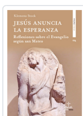
Jesús anuncia la esperanza Klemens Stock