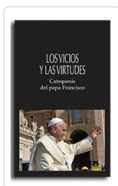
Los vicios y las virtudes Francisco, Papa