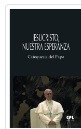
Jesucristo, nuestra esperanza papa León XIV