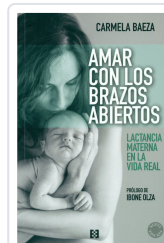
AMAR CON LOS BRAZOS ABIERTOS (NUEVA ED.) BAEZA, C.