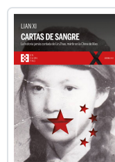
CARTAS DE SANGRE XI, LIAN