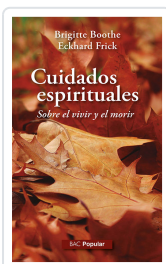
CUIDADOS ESPIRITUALES. Nº 248 SOBRE EL VIVIR Y EL MORIR BOOTHE, BRIGITTE