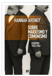
SOBRE MARXISMO Y COMUNISMO ARENDR, HANNAH