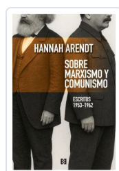
SOBRE MARXISMO Y COMUNISMO ARENDR, HANNAH