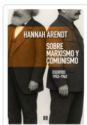
SOBRE MARXISMO Y COMUNISMO ARENDR, HANNAH