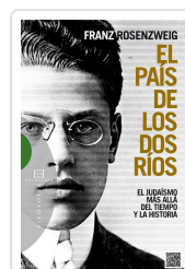
PAIS DE LOS DOS RÍOS ROSENZWEIG, FRANZ