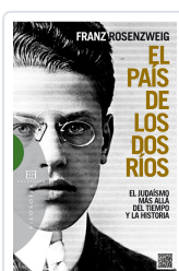
PAIS DE LOS DOS RIOS ROSENZWEIG, FRANZ