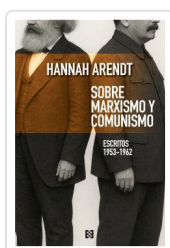
SOBRE MARXISMO Y COMUNISMO ARENDR, HANNAH