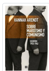
SOBRE MARXISMO Y COMUNISMO ARENDR, HANNAH