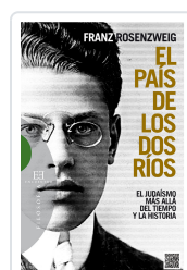
PAIS DE LOS DOS RIOS ROSENZWEIG, FRANZ