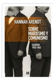
SOBRE MARXISMO Y COMUNISMO ARENDR, HANNAH