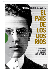
PAIS DE LOS DOS RIOS ROSENZWEIG, FRANZ