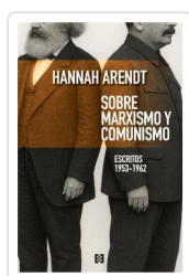
SOBRE MARXISMO Y COMUNISMO ARENDR, HANNAH