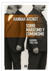
SOBRE MARXISMO Y COMUNISMO ARENDR, HANNAH