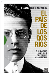
PAIS DE LOS DOS RIOS ROSENZWEIG, FRANZ