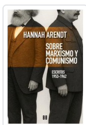
SOBRE MARXISMO Y COMUNISMO ARENDR, HANNAH