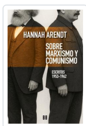
SOBRE MARXISMO Y COMUNISMO ARENDR, HANNAH