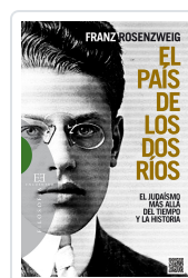
PAIS DE LOS DOS RIOS ROSENZWEIG, FRANZ