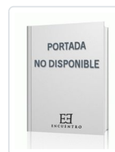
CUMBRES ABISMALES. 1 ZINOVIEV