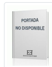
CUMBRES ABISMALES. 1 ZINOVIEV