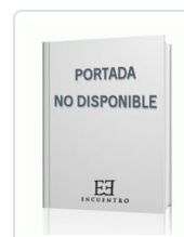
CUMBRES ABISMALES. 1 ZINOVIEV