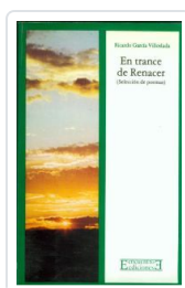
EN TRANCE DE RENACER GARCIA VILLOSLADA