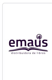
MISTERIO DE LA CARIDAD DE JUANA DE ARCO PEGUY, CHARLES