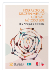
Liderazgo de discernimiento eclesial: Método LIDE LIDE, Equipo