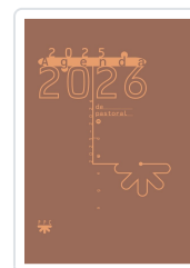
AGENDA DE PASTORAL 2025-2026 PPC PPC