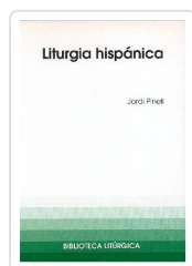
LITURGIA HISPANICA Nº9 PINELL, JORDI