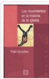
MOVIMIENTOS EN LA Hª DE LA IGLESIA GONZALEZ, FIDEL