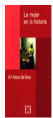
MUJER EN LA Hª, LA BEL BRAVO