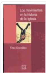
MOVIMIENTOS EN LA Hª DE LA IGLESIA GONZALEZ, FIDEL