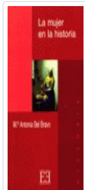
MUJER EN LA Hª, LA BEL BRAVO