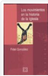
MOVIMIENTOS EN LA Hª DE LA IGLESIA GONZALEZ, FIDEL