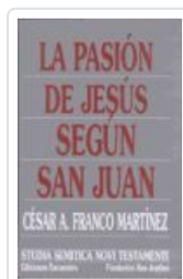
PASION DE JESUS SEGUN SAN JUAN FRANCO MARTINEZ