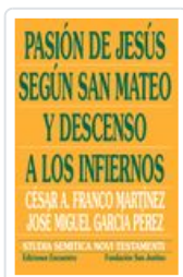
PASION DE JESUS SEGUN SAN MATEO Y DESCENSO A LOS INFIERNOS FRANCO/GARCIA