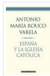
ESPAÑA Y LA IGLESIA CATOLICA ROUCO VARELA, ANTONIO MARIA