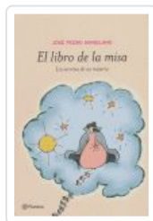
LIBRO DE LA MISA, EL MANGLANO