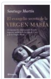
EVANGELIO SECRETO (GRANDE PANETA) VIRGEN MARIA MARTIN, SANTIAGO