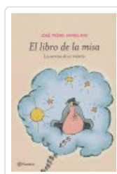
LIBRO DE LA MISA, EL MANGLANO