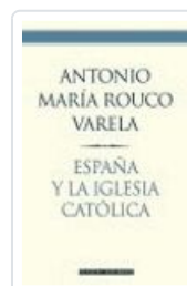
ESPAÑA Y LA IGLESIA CATOLICA ROUCO VARELA, ANTONIO MARIA