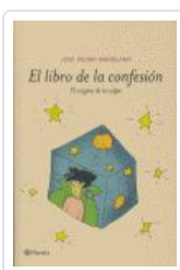
LIBRO DE LA CONFESION MANGLANO