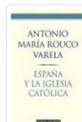
ESPAÑA Y LA IGLESIA CATOLICA ROUCO VARELA, ANTONIO MARIA