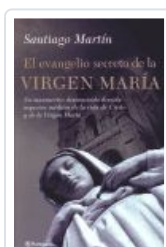
EVANGELIO SECRETO (GRANDE PANETA) VIRGEN MARIA MARTIN, SANTIAGO