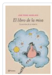
LIBRO DE LA MISA, EL MANGLANO