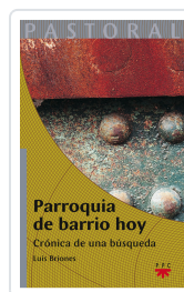
PARROQUIA DE BARRIO HOY BRIONES, LUIS