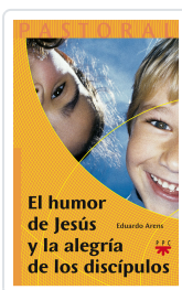
HUMOR DE JESUS Y LA ALEGRÍA DE LOS DISCIPULOS ARENS